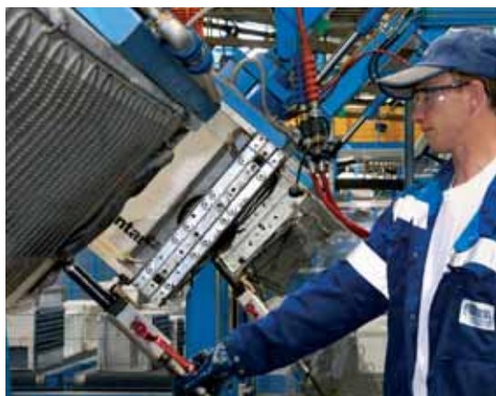
Débarrassé de son fréon, ce réfrigérateur sera moins dangereux pour l'environnement.

Le petit électroménager (grille-pain, ordinateur, aspirateur...) est démonté puis trié afin de séparer les matériaux recyclables et les composants électroniques. Le tout est ensuite recyclé.